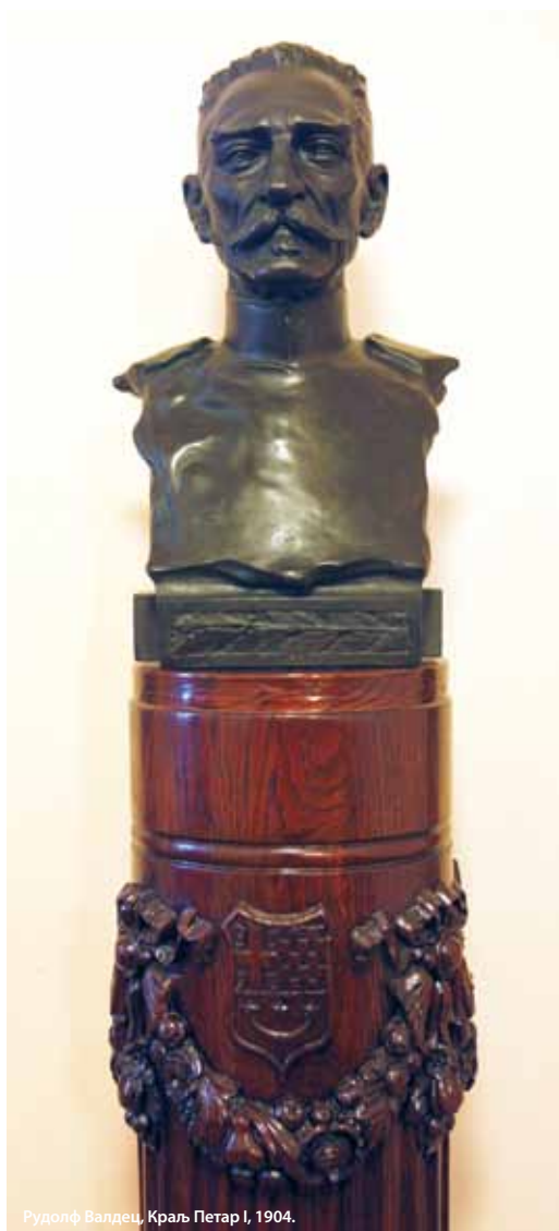
Рудолф Валдец, Краљ Петар I, 1904.