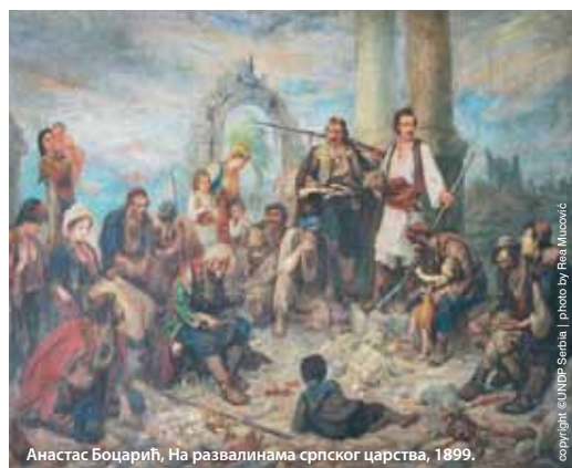
Анастас Боцарић, На развалинама српског царства, 1899.