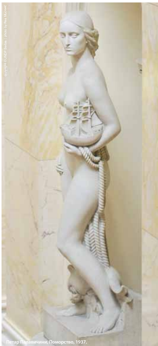
Петар Палавичини, Поморство, 1937.