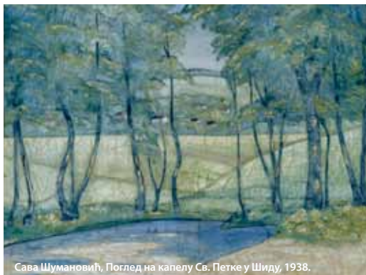
Сава Шумановић, Поглед на капелу Св. Петке у Шиду, 1938.