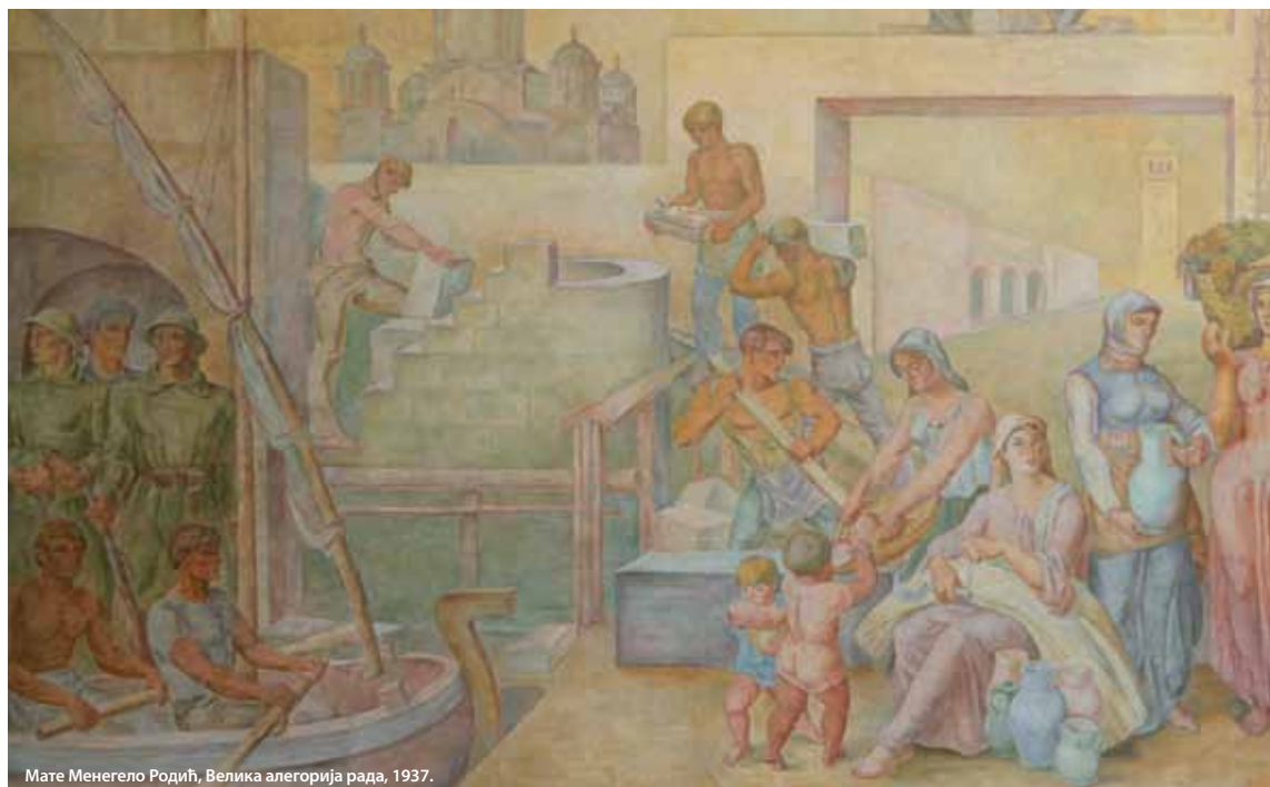
Мате Менегело Родић, Велика алегорија рада, 1937.