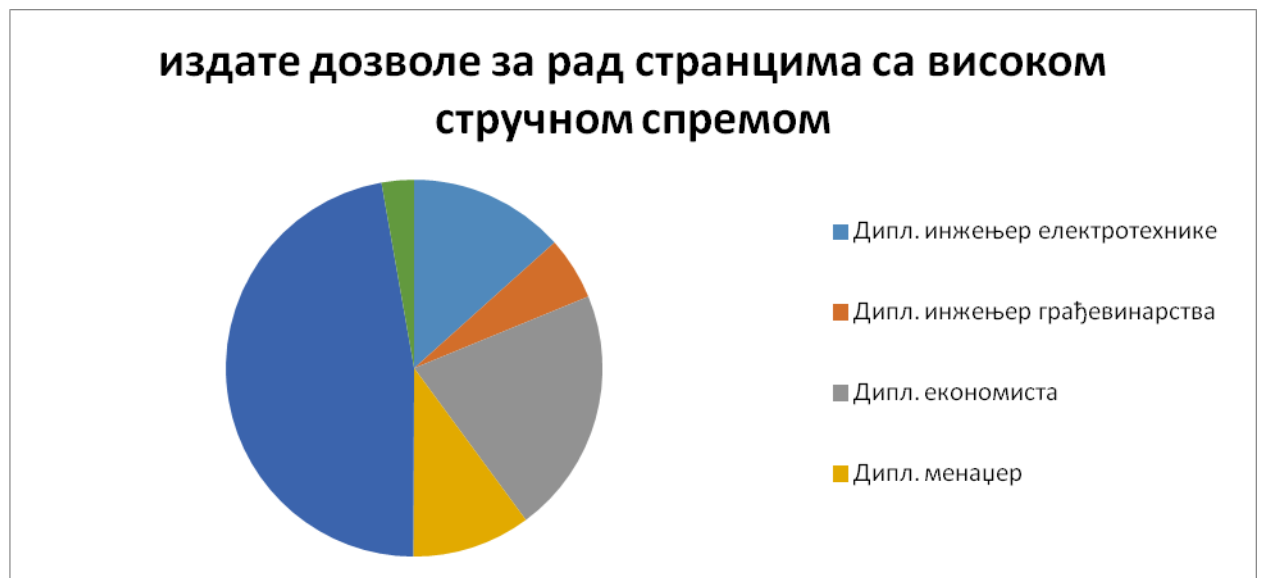
дозволе за рад издате странцу са високом стручном спремом

Анализа напред наведених података показује свакако позитивне ефекте примене Закона о запошљавању странаца, који дају много прецизнију слику о броју и кретању странаца који остварују права по основу рада у Републици